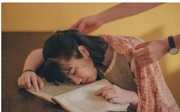
Naasten in hun kracht

Wij zijn als broeders en zusters verbonden met elkaar. Eensgezind in het goede. Uit welke stad of land wij ook samenkomen, uit welke familie ook voortgekomen. Draag elkaar en je zult gedragen worden. Troost een mens die rouwt, en je zult troost vinden bij een mens die blij is. Richt een gevallen op. Wij zijn allemaal breekbare mensen. ( H.15)