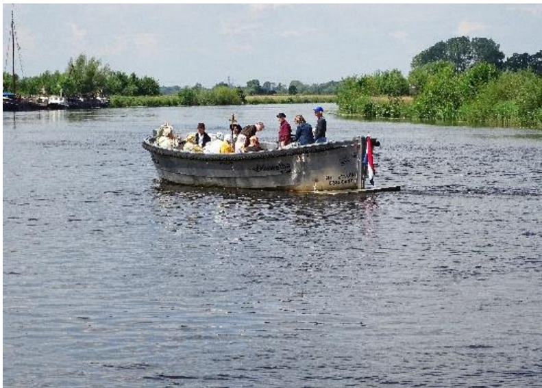
Thomas a Kempis vlucht weg van de Agnietenberg