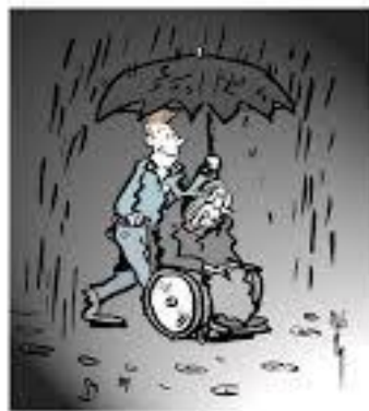
Fonds NutsOins Slyttenko van Lee