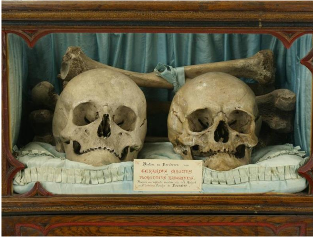
Schedels Geert Groote en Florens Radewijns