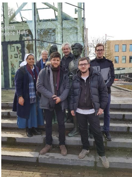
Broeders en Zusters van de Moderne Devotie uit Weilham ( BRD) , op bezoek in het IJsselgebied

Ga niet af op wat populair is onder de mensen, of meegaan met de volgende hype. Het gaat er juist om je te richten op wat jou en anderen goed doet.